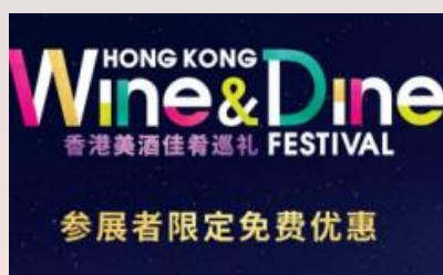
香港美酒佳肴巡礼免费参展旅客礼包