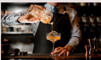
兩杯免費迎賓飲品

參觀十月假香港會議展覽中心舉行的香港貿發局香港國際秋季燈飾展，從一系列專屬體驗中選擇一項禮遇：