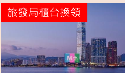
免費M+博物館一天入場門票