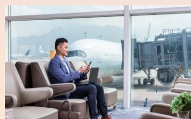
香港環亞機場貴賓室90分鐘免費體驗