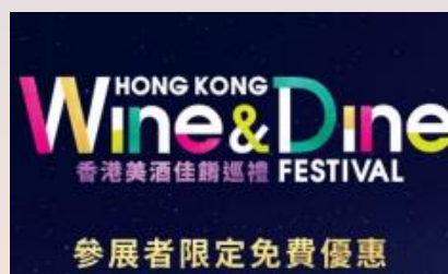
香港美酒佳餚巡禮免費參展旅客禮包